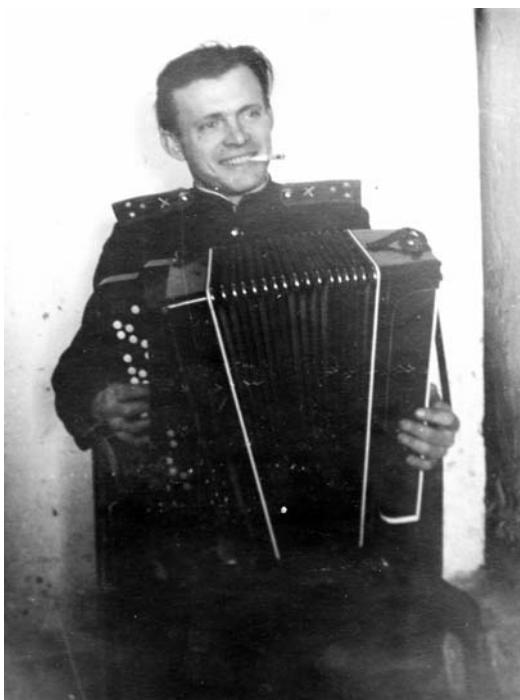
1953 г. Замполит доволен: его батарея за успехи получила в подарок баян

Начали мы грызть науку. Основы марксизма-ленинизма, партполитработу, тактику, огневую подготовку. Программа рассчитана на три месяца. Местное население – мадьяры – относились к нам лояльно, хотя близости с нами не было. Каждый сам по себе.