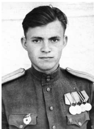
1948 г. Румыния

на шомпол и засовывали в бочку, где минут 40–45 пропаривали. Бывали, но реже спецмашины для этой цели.