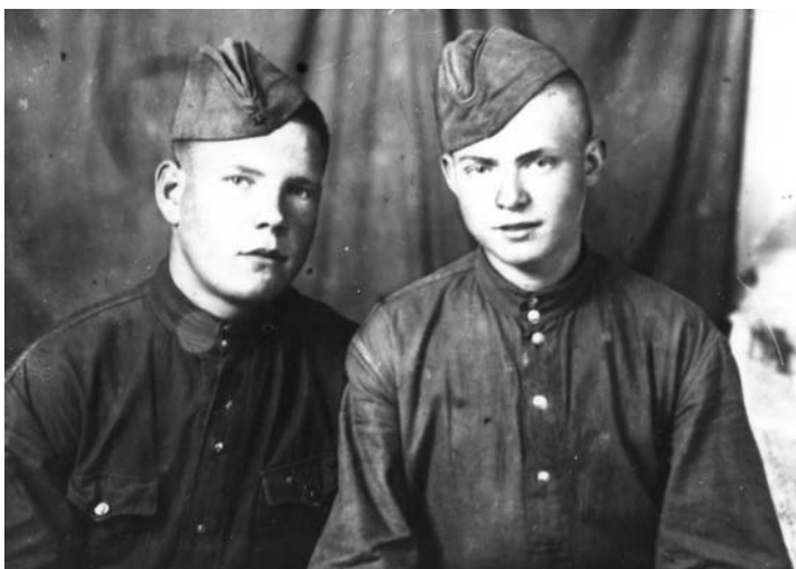
1943 г. Чувашия. Начало службы в армии