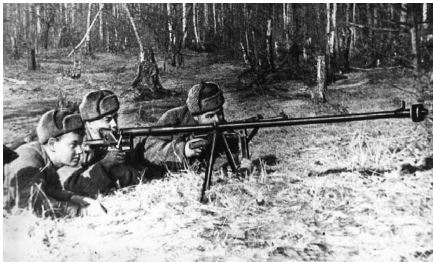
Расчёт противотанкового ружья

Подготовка к форсированию была недолгой. 6 ноября посадили нас в лодки – и пошёл. Я был назначен командиром группы из восьми человек, один из которых вооружён пулемётом Дегтярёва.