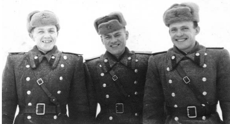
1945 г. Агалатово