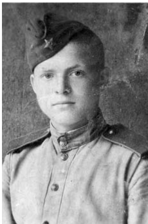
1944 г. Ржев. Перед отправкой на фронт

возвращались ни с чем, нередко с убитыми и ранеными на плечах.