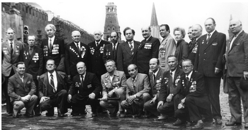
9 мая 1985 г. Ветераны 84-й дивизии на Красной площади